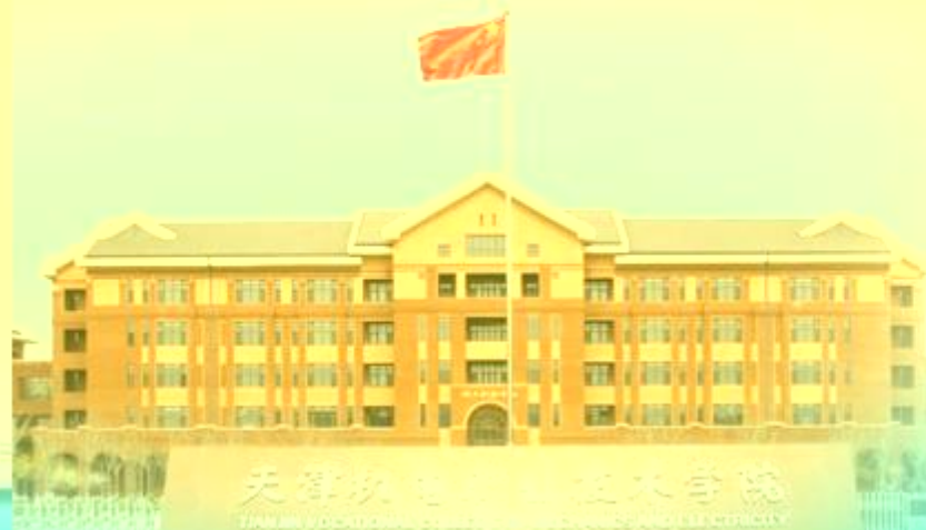
天津机电职业技术学院 TIANJIN VOCATIONAL COLLEGE OF ELECTRICITY AND MECHANICAL TECHNOLOGY